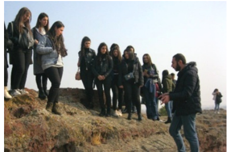
Նկար 2. ՎՊՀ ուսանողների դաշտային պրակտիկան Մեծամորի հնավայրում (2019 թ.)